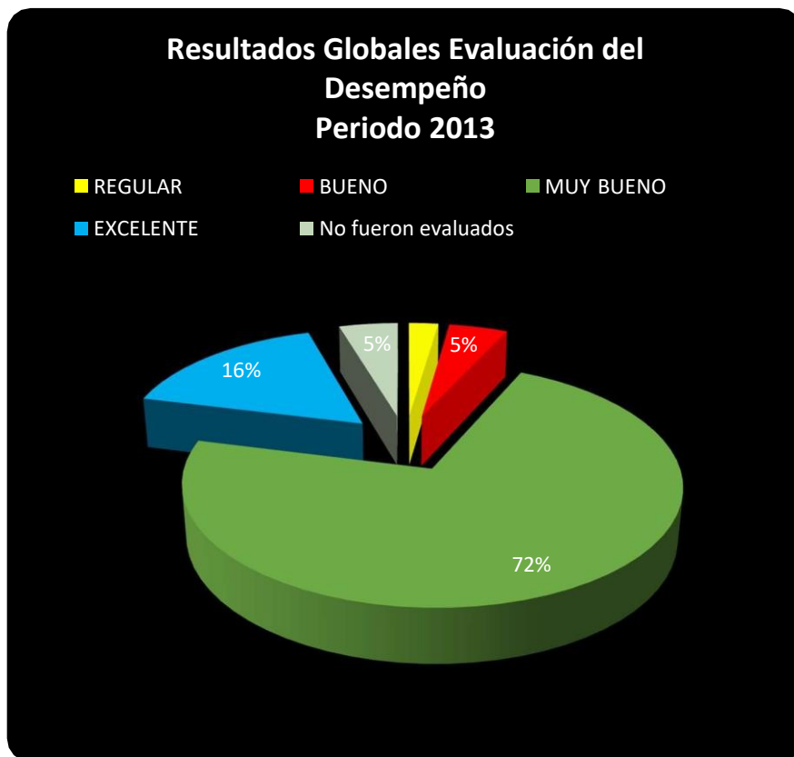
Gráfico de distribución de evaluaciones con respuesta según tipo

El presente informe se desarrolla con los resultados de las evaluaciones que corresponden a un total de 210 evaluados, distribuidos según tipo de evaluación como se señala a continuación.