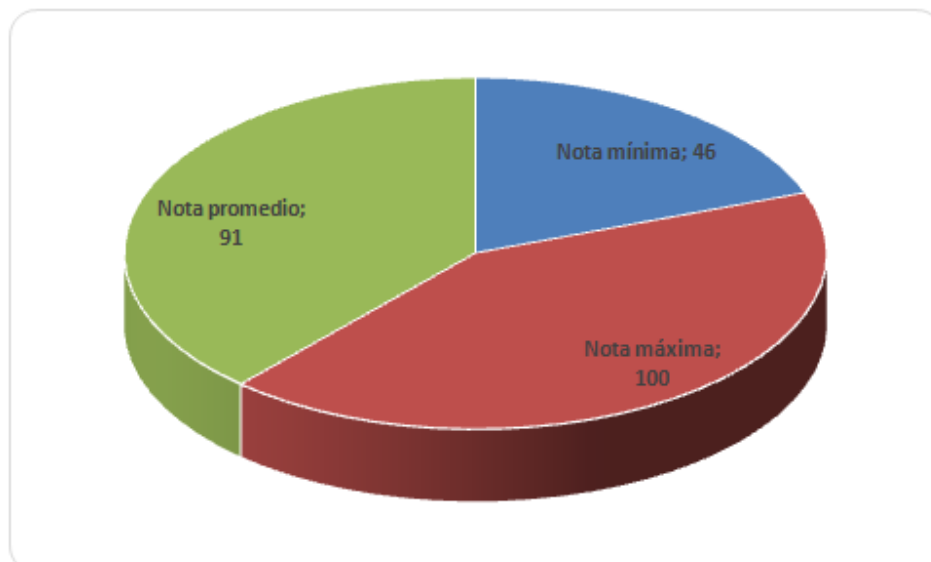
Gráfico de distribución de promedio de evaluaciones